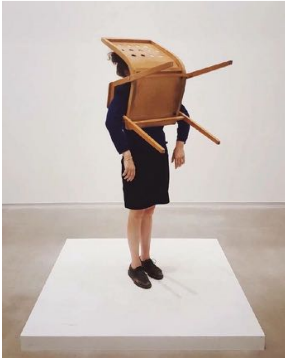
Erwin Wurm: One Minute Sculpture, 2016